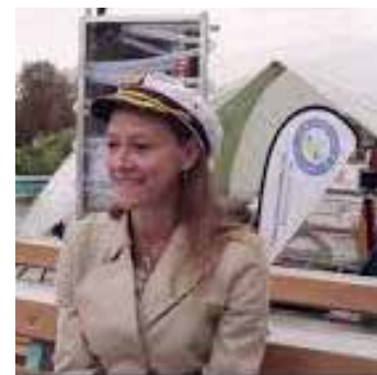
Veranstalter: science2public – Gesellschaft für Wissenschaftskommunikation e.V.

Zielgruppe: 6. bis 13. Klasse, Lehrer*innen, Erzieher*innen, Multiplikator*innen, Studierende Fächer: Biologie, Deutsch, Ethik, Religion, Geographie, Kunst, Sachkunde, Sozialkunde, Technik Zeitraumen: 2 bis 3 Unterrichtsstunden, ein bis mehrere Projektstage, Projektwoche Region: beim Veranstalter vor Ort