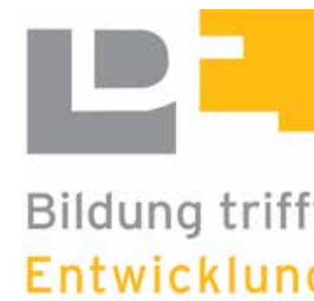
Veranstalter: Bildung trifft Entwicklung Mitteldeutschland - Programmlinie CHAT der WELTEN (CdW)

Filmisch auf die drängenden weltweiten Herausforderungen aufmerksam machen, das ist das Ziel für dieses Projekt! Dabei beschäftigen sich die Schüler:innen zunächst inhaltlich mit dem Thema Klimawandel. Das können kleine Filmreportagen, Aktionsspiele, Lückentexte, Diskussionen oder ein Quiz sein. Im Anschluss denken sich die Teilnehmenden in kleinen Gruppen jeweils eine Filmidee zum Thema Klimawandel aus. Von der Produktion bis zum Schnitt – die Teilnehmenden werden durch alle Schritte begleitet und am Ende werden die Produktionen gemeinsam angeschaut und diskutiert.