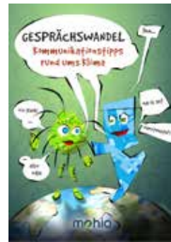
Veranstalter: mohio e.V.

Zielgruppe: 9. bis 13. Klasse, Lehrer*innen, Erzieher*innen, Multiplikator*innen, Studierende Fächer: Deutsch, Ethik, Religion, Geographie, Sachkunde, Sozialkunde Zeitraumen: 3 Unterrichtsstunden, ein bis mehrere Projektstage, nach Absprache Region: ganz Sachsen-Anhalt