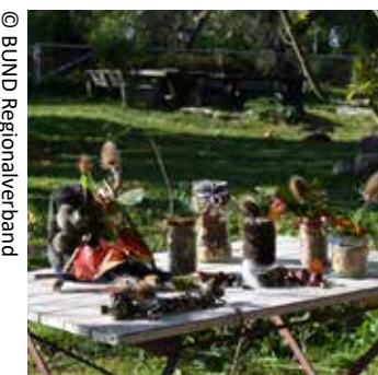
Veranstalter: BUND-Regionalverband Halle-Saalekreis Umweltzentrum Franzigmark

Wolle, Papierschöpfen, Malen mit Naturpigmenten, Basteln: Die Natur hat so viel zu bieten – wir gehen zusammen im Umweltzentrum und der Umgebung auf Erkundungstour, sammeln bunte Blätter, Früchte, Blüten und Wurzeln in verschiedenen Farben und Formen und nutzen sie zum Gestalten schöner Dinge.