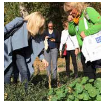
Veranstalter: science2public – Gesellschaft für Wissenschaftskommunikation e.V.

Zielgruppe: für alle, interessierte Bürger*innen, Touristen Fächer: Biologie, Chemie, Geographie, Englisch, Ethik, Religion, Sachkunde, Sozialkunde, Technik, Informatik Zeitraumen: 2 bis 3 Unterrichtsstunden, Projekttag Region: beim Veranstalter vor Ort