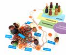
@ mohio e.V.